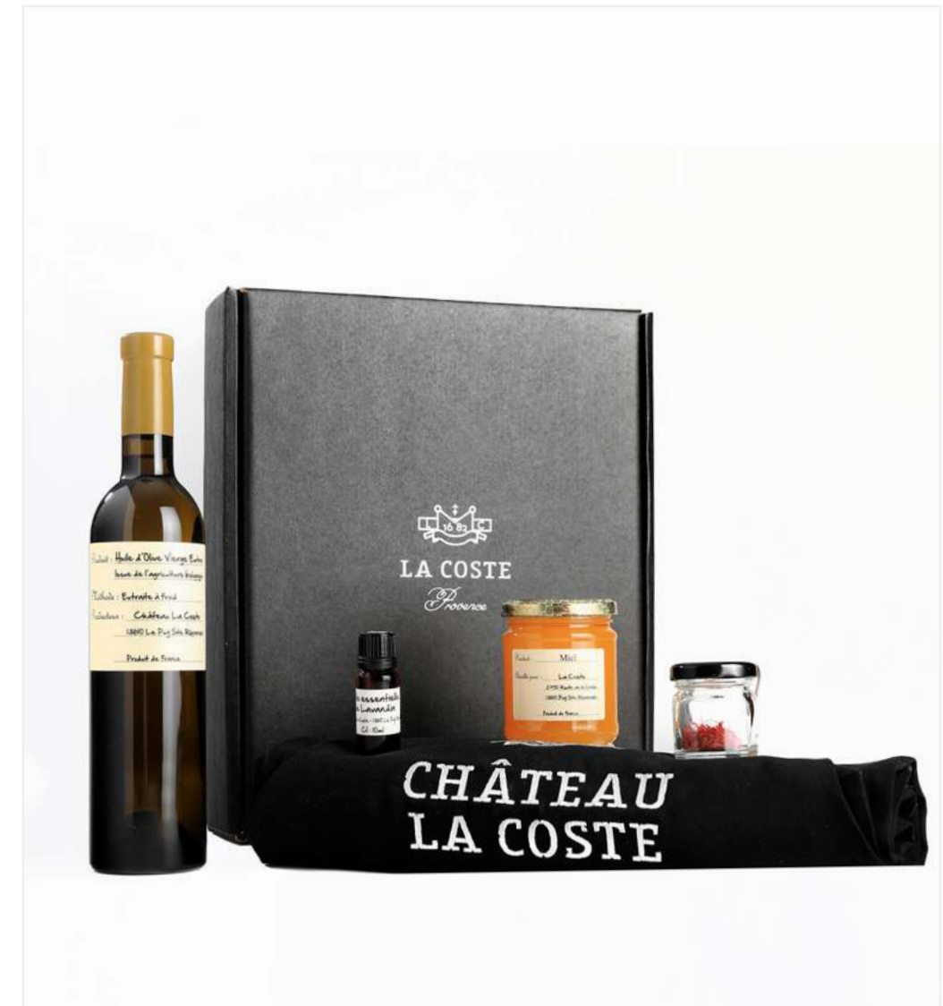
1 bouteille d'huile d'olive 50cl, Huile essentielle de lavandin 10cl, Safran du Puy-Ste-Réparate 2g, Miel de Provence 250g, 1 tablier brodé Château La Coste