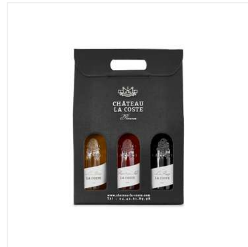
COFFRET CABAS 3 BOUTEILLES