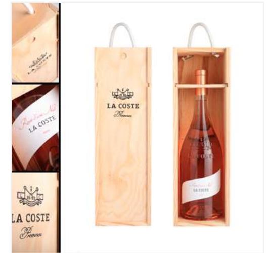
COFFRET BOIS - MAGNUM