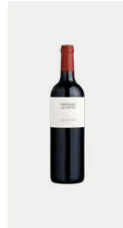
CHÂTEAU ROSÉ ET LES PENTES DOUCES Le cœur de notre marque