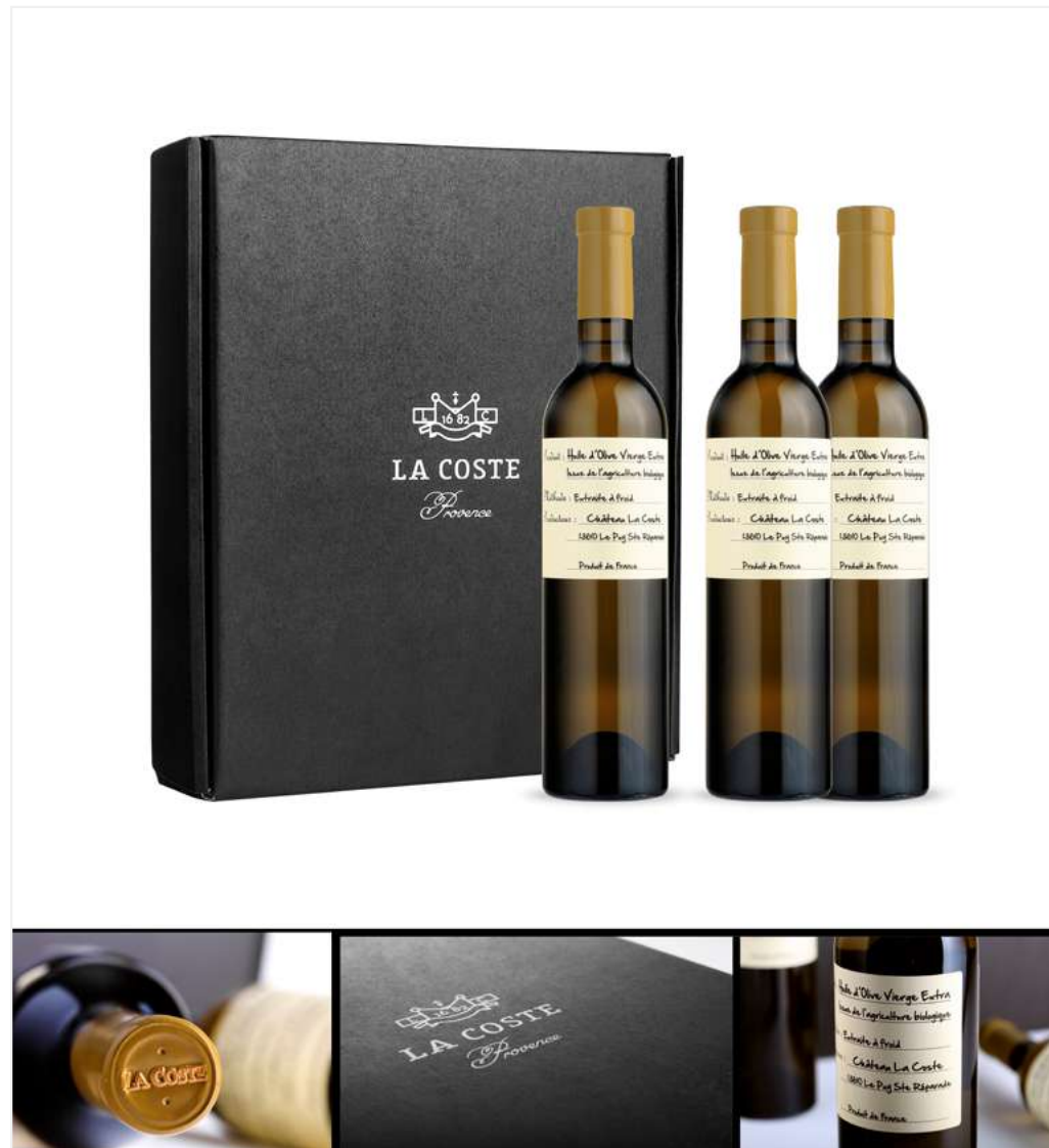
Trilogie d'Huile d'olive Château La Coste