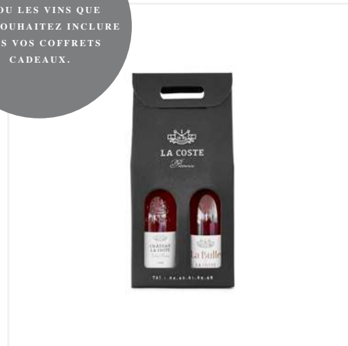
COFFRET CABAS 2 BOUTEILLES

CHOISISSEZ LE OU LES VINS QUE VOUS SOUHAITEZ INCLURE DANS VOS COFFRETS CADEAUX.