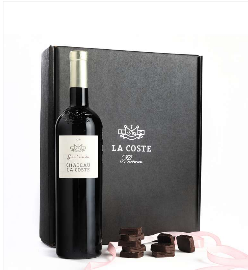
1 bouteille de Grand Vin Rouge et 1 boîte de chocolats Puyricard aromatisés au Grand Vin Rouge