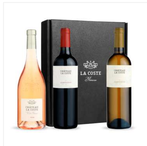
COFFRET CADEAU NOIR