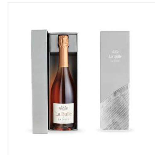
COFFRET ÉCRIN LA BULLE