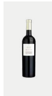
GRAND VIN Cuvée gastronomique du Domaine