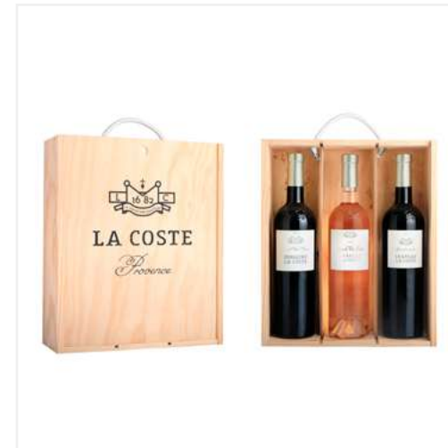
COFFRET BOIS 3 BOUTEILLES