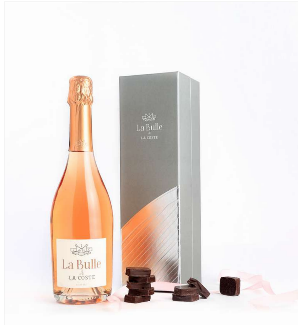
1 bouteille de La Bulle dans son écrin et une boîte de chocolats Puyricard aromatisés au Vin Rosé