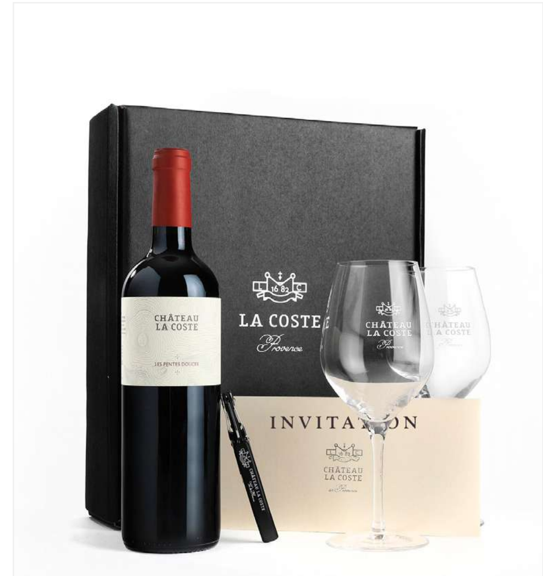
1 Bouteille de Pentes Douces Rouge, 2 verres à vin, 1 sommelier, Invitation à un atelier Dégustation pour 2 pers.