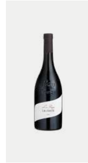
LA COSTE Cuvée légère et fruitée